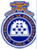
Universidad la Frontera

Proyecto “Fortalecimiento del Nodo Chile para el Campus Virtual de Salud Pública”