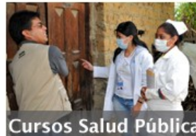
Cursos Salud Pública

Una red para crear, compartir y colaborar en los procesos educativos de Salud Pública. Usted puede encontrar: